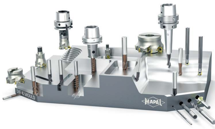
Bild 2: MAPAL ist Komplettanbieter für den Werkzeug- und Formenbau und präsentiert das umfangreiche Programm auf der Messe.

Telefon: +49 7361 585-3683 Telefax: +49 7361 585-1019 E-Mail: presse@mapal.com